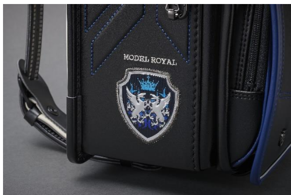
見る角度によってデザインが変化する チェンジングワッペン

「モデルロイヤル ドラグーン」は、竜騎士をメインモチーフに、金属パーツをブラックニッケルに統一してスタイリッシュに仕上げています。側面のドラゴンをあしらったチェンジングワッペン、見る角度によって背景のデザインが炎から剣に変化します。前ポケットには、剣のモチーフの型押しがあしらわれ、引き手も剣型で統一。ドラゴンをモチーフにした飾り鉤（びょう）など細部のデザインまでこだわっています。