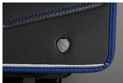
カブセにはドラゴンをモチーフにした飾り鉤（びょう）