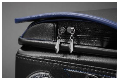
前ポケットには剣型の引き手