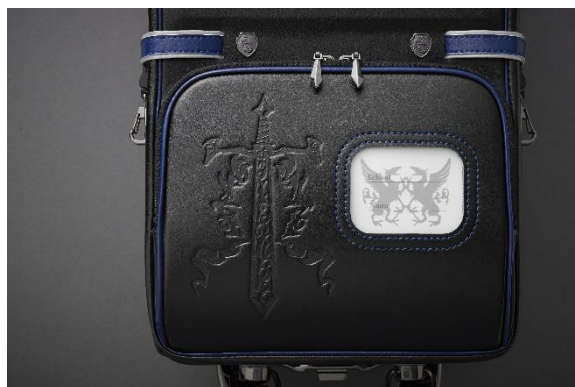
剣のモチーフがあしらわれた前ポケット